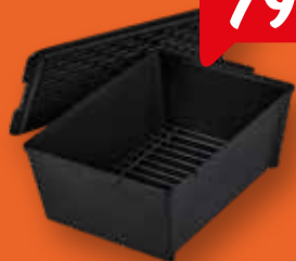
Enders Dutch Oven